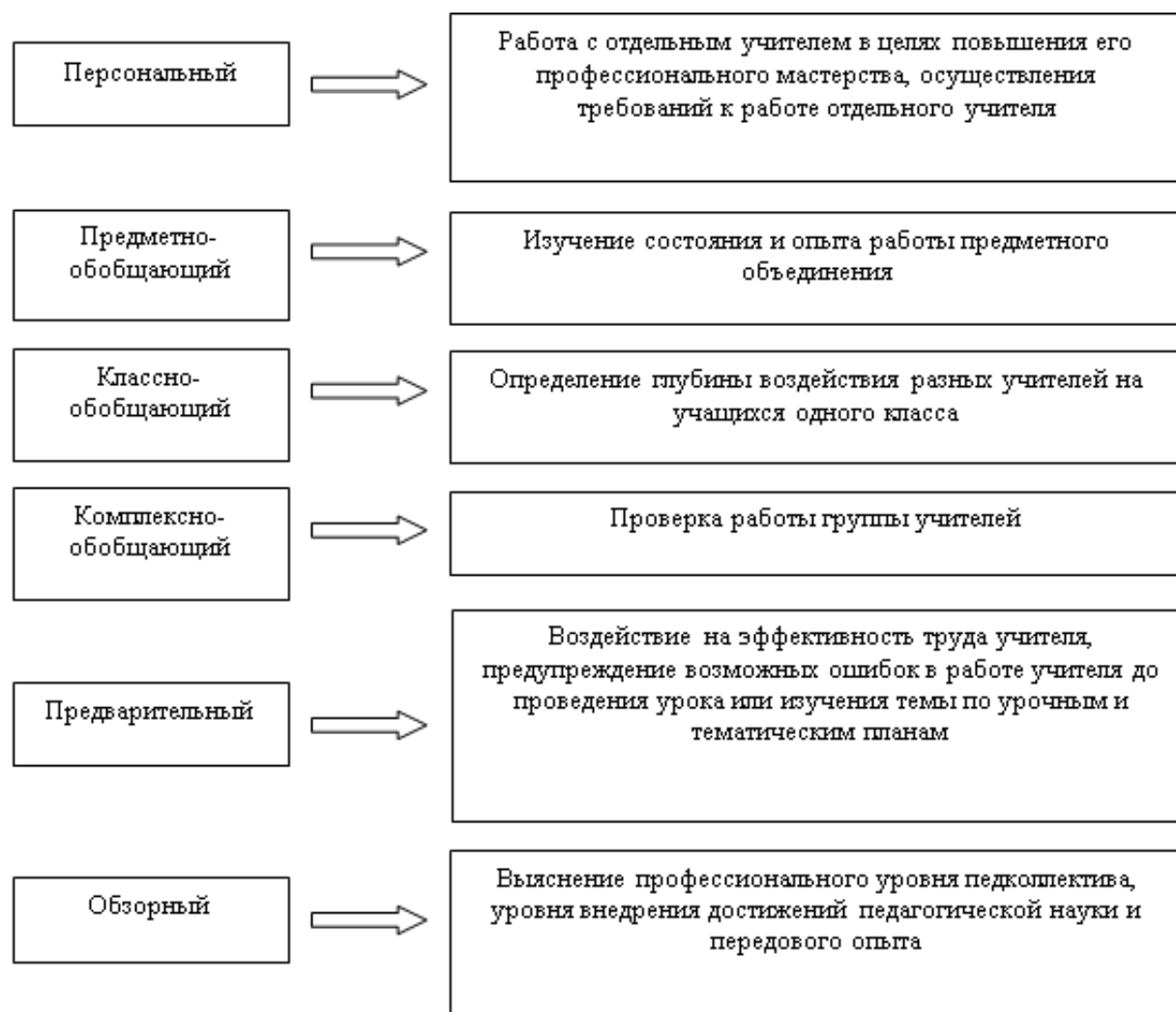
Рисунок 3. Формы внутришкольного контроля

С учетом того, что контроль осуществляется за деятельностью отдельного учителя, группы учителей, всего педагогического коллектива выделяются несколько форм контроля: персональный, классно-обобщающий, предметно-обобщающий, тематически-обобщающий, комплексно-обобщающий (Рис.3)